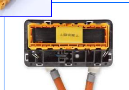
(寸法: 約 72 x 147 x 63 mm)