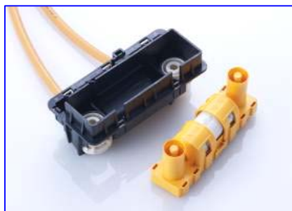
左: ヒューズボックス 右: ヒューズキャリア