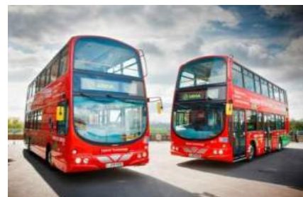
ハイブリッドバス