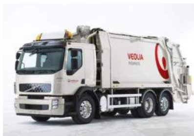
ハイブリッドトラック / ごみ収集車