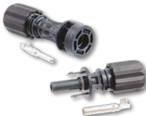
上: H4 UTX オス (ピンコンタクト) 下: H4 UTX メス (ソケットコンタクト)